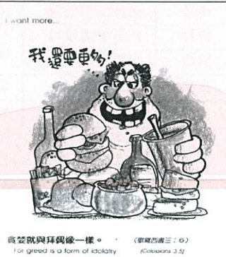
貪婪就與拜偶像一樣。(啟蒙福音三: 6) I or greed is a form of idolatry. (Cokesana 3: 6)

聖經並沒有叫人不要有慾望。人有慾望是正常的, 問題就在於想要滿足不正當或不該有的慾望。貪婪的罪就是因不分的慾望而起。貪婪是想要擁有更多, 為滿足私慾, 千方百計的不斷去追逐, 甚至到一個程度, 把它視為生命中最首要優先的位置。任何取代上帝位置的人物, 就是偶像。因此保羅說: 「貪婪和拜偶像一樣, 是萬惡的根源」(提前 6: 10)。基督徒可能不會去拜有形的偶像, 但我們可能向無形的偶像下拜。貪婪就是其中一個我們最容易跪拜的無形偶像。「貪」說明了我們不滿意上帝所賜給的, 我們感到不滿足, 因此就否定了上帝, 自認自己比上帝高明, 比上帝更清楚我們需要的是什麼。另外, 「貪」往往會使人失去理智, 譬如: 有人貪美食, 於是成了食物的奴隸; 有人則向金錢下拜, 錢財就成了他們的偶像。人的慾望永不止盡, 不滿足于房子比別人小、車子比別人差、工作比別人差、工資比別人少等等不滿足。基督徒的生活是需要以上的物質, 但不能讓它們來取代上帝, 成為了我們的主人, 否則, 它們就會成為無形的偶像。